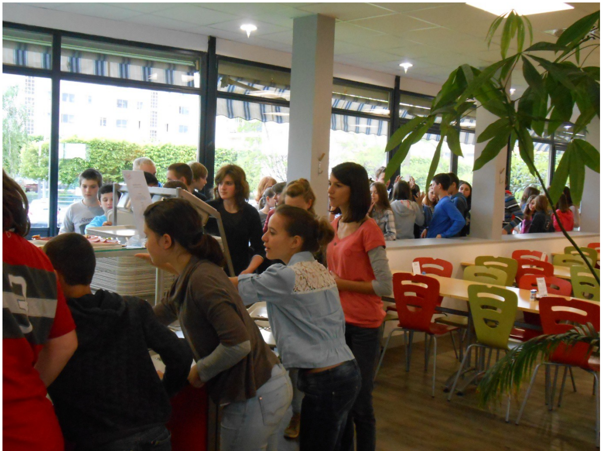
Petit déjeuner à l'auberge de jeunesse.